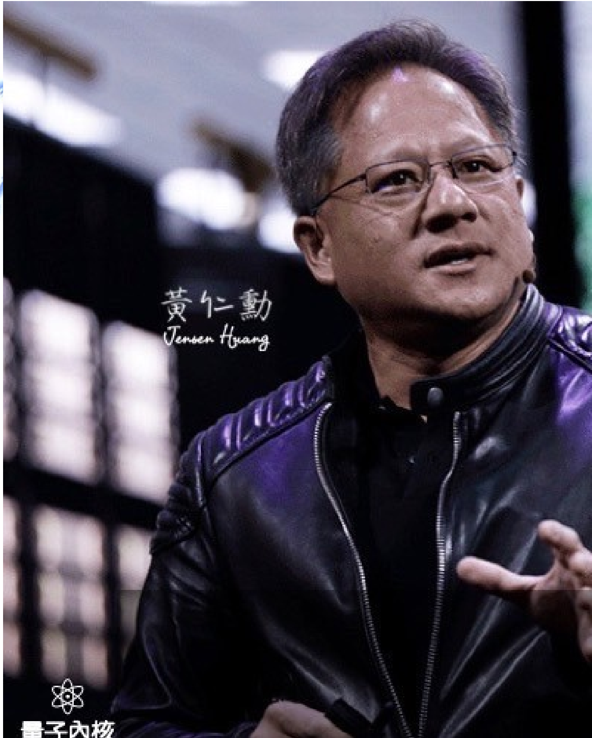
黃仁勳 Jensen Huang