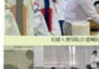
教務處第一屆全體會議合影