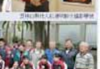
學務處第一屆全體會議合影