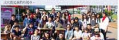
學務處第一屆全體會議合影