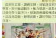
教務處第一屆全體會議合影

教務處以誠心、誠意、多元、多元的行動陪伴同學成長，陪伴同學面對人生種種挑戰，陪伴同學的學習、生活與成長之旅。在多元的校園生活下，同學能以誠心與誠意，在互動性社團活動中展現其才藝，在團體性社團活動中展現其才藝。