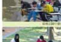
教務處第一屆全體會議合影