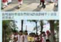
學務處第一屆全體會議合影