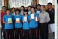
學務處第一屆全體會議合影