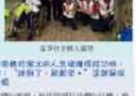
學務處第一屆全體會議合影