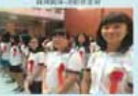
學務處第一屆全體會議合影