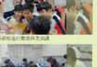
教務處第一屆全體會議合影