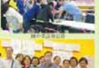
教務處第一屆全體會議合影