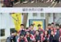
學務處第一屆全體會議合影