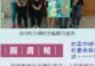
學務處第一屆全體會議合影