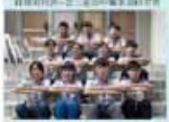
學務處第一屆全體會議合影