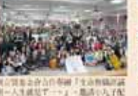
輔導室第一屆全體會議合影