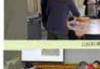
教務處第一屆全體會議合影