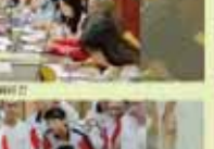
教務處第一屆全體會議合影