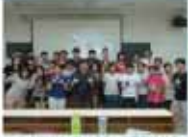
學務處第一屆全體會議合影