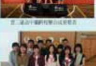
學務處第一屆全體會議合影