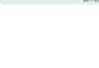
總務處第一屆全體會議合影