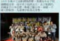
學務處第一屆全體會議合影