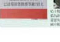
輔導室第一屆全體會議合影