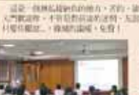
輔導室第一屆全體會議合影

輔導室以誠心、誠意、多元、多元的行動陪伴同學成長，陪伴同學面對人生種種挑戰，陪伴同學的學習、生活與成長之旅。在多元的校園生活下，同學能以誠心與誠意，在互動性社團活動中展現其才藝，在團體性社團活動中展現其才藝。