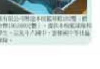
輔導室第一屆全體會議合影