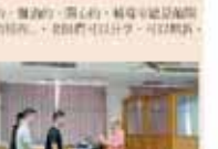
輔導室第一屆全體會議合影