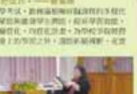
教務處第一屆全體會議合影