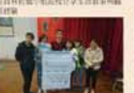
輔導室第一屆全體會議合影