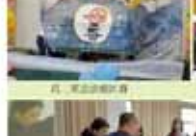
教務處第一屆全體會議合影