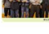
教務處第一屆全體會議合影