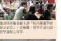
輔導室第一屆全體會議合影