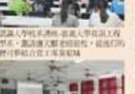
輔導室第一屆全體會議合影