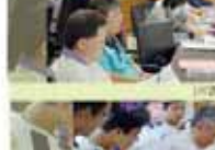
教務處第一屆全體會議合影