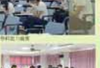
教務處第一屆全體會議合影