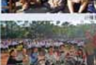
學務處第一屆全體會議合影