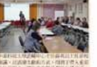
輔導室第一屆全體會議合影