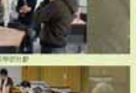
教務處第一屆全體會議合影