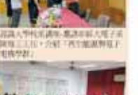
輔導室第一屆全體會議合影