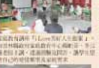
輔導室第一屆全體會議合影