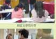
教務處第一屆全體會議合影