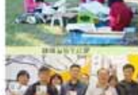
教務處第一屆全體會議合影