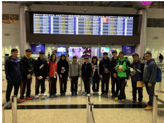
桃園機場出發前合影