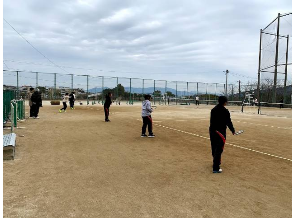
韓國又石高校聯誼賽