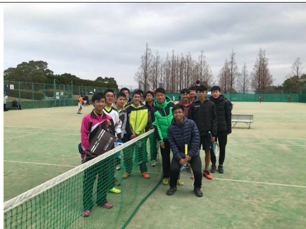
男子組團體賽合影