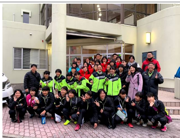
台日韓交流學校合影