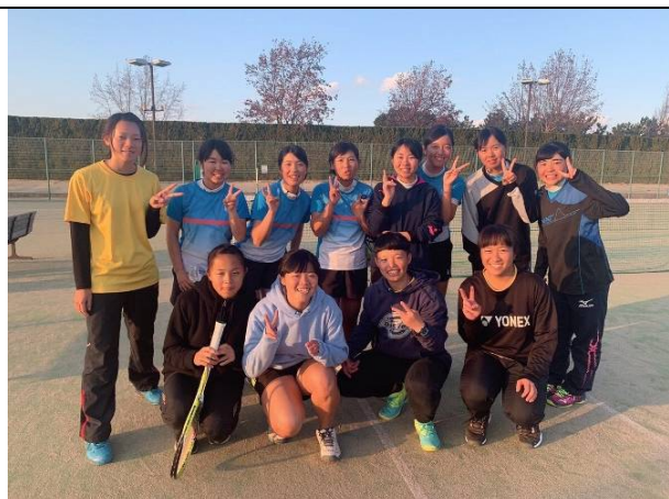
福翔高校團體賽合影