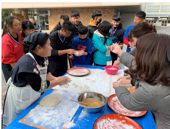
體驗日本新年活動