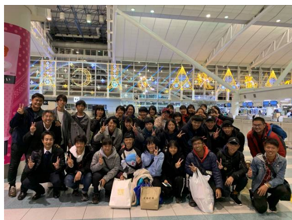
福岡機場出境合影