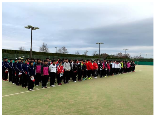
福岡國際大會開幕式