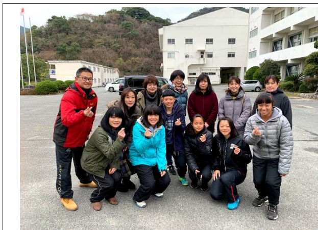
協行日本媽媽合影