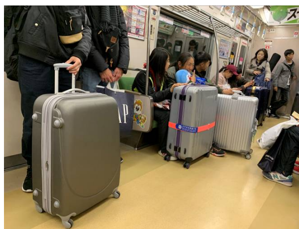
搭乘福岡大眾運輸系統