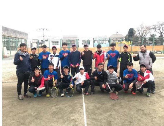
福岡講倫館高校協同練習