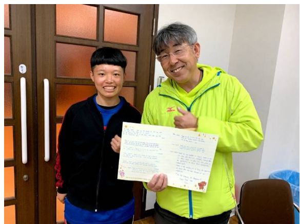
致贈感謝卡給立道教練，感謝招待