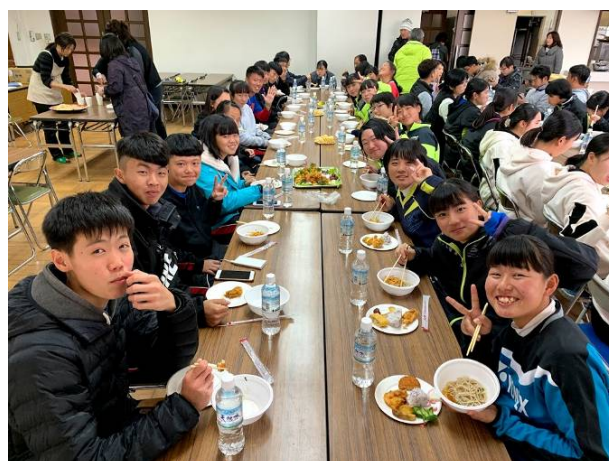
享用日本新年傳統食物蕎麥麵