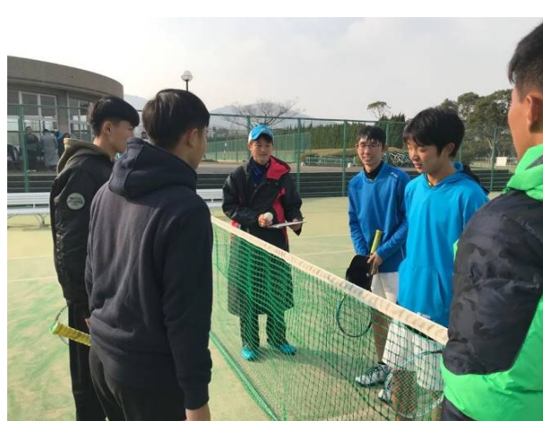
男子組團體賽合影