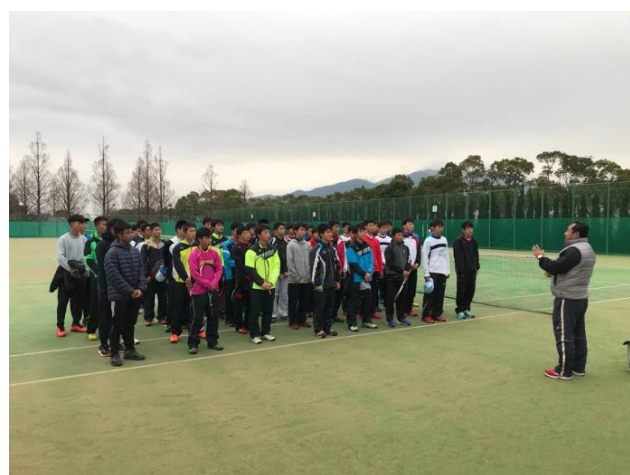
男子組團體賽合影