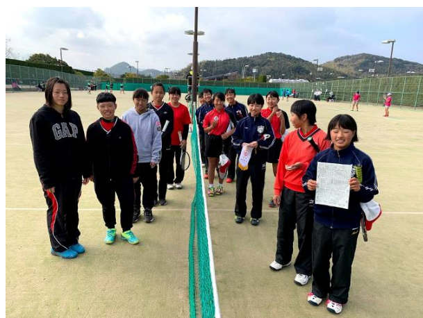
下門中學校團體賽合影