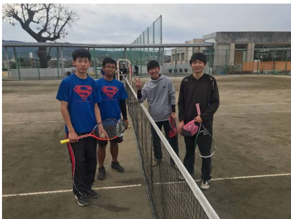
福岡講倫館高校協同練習