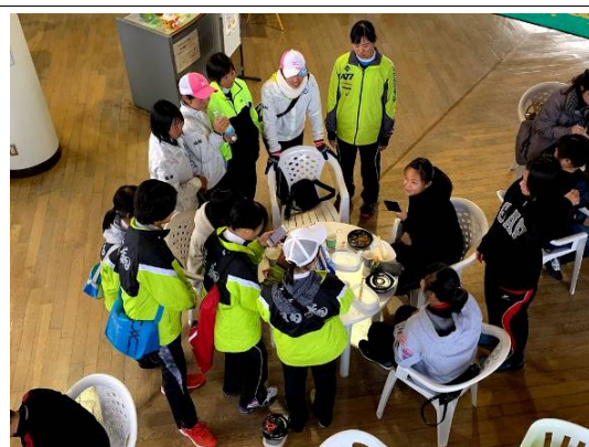
與日本高校學生交流互動