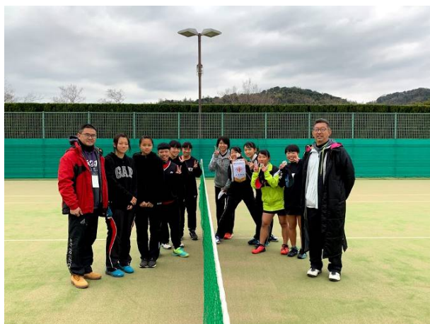
福翔高校團體賽合影