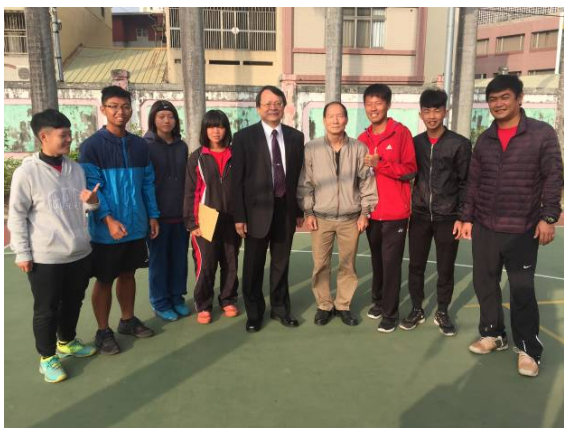
學生代表致贈感謝卡