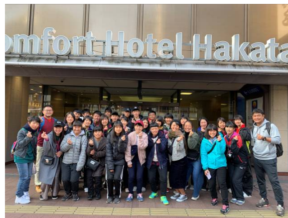
一日市區觀光自由行