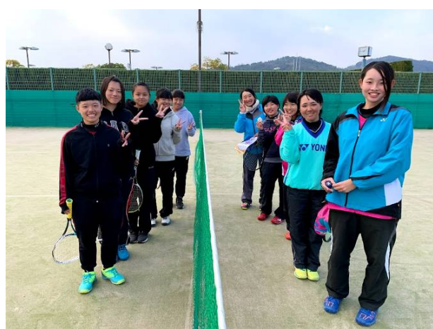
青豐高校團體賽合影