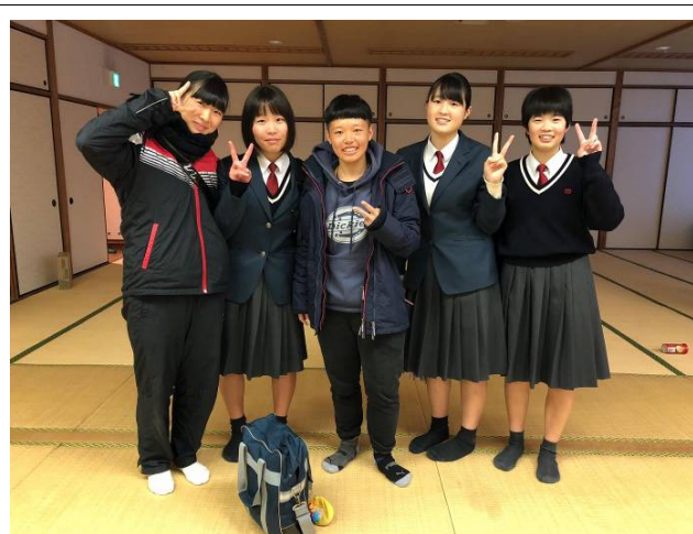
8月來台交流學生學校探班致意