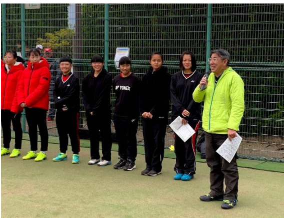
福岡國際大會開幕式