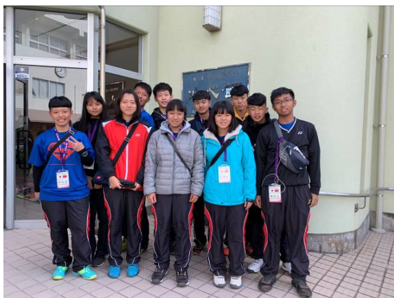
SMEINER HOUSE 合影