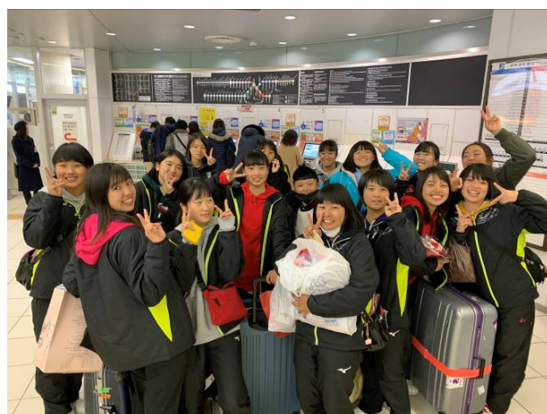
福岡西陵高校陪同送機