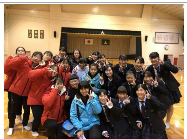
韓國又石高校、福岡講倫館高校合影