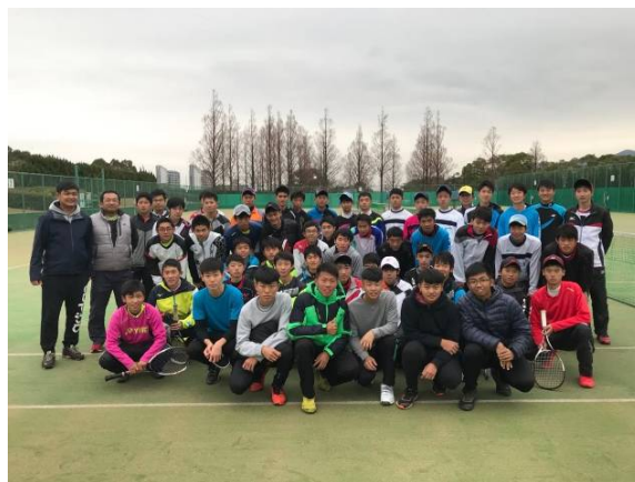
男子高校交流賽賽前合影