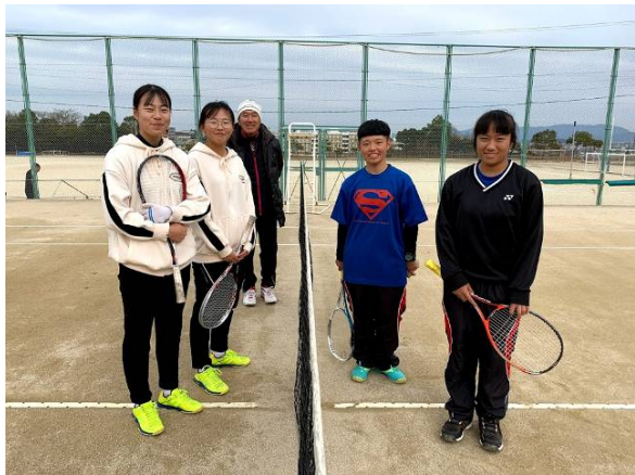
韓國又石高校聯誼賽