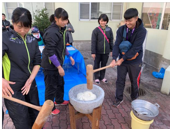
體驗日本新年活動