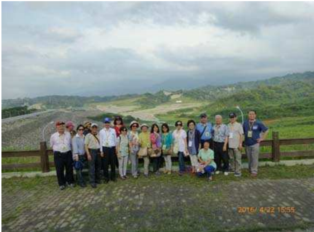
第二十屆校友們合照