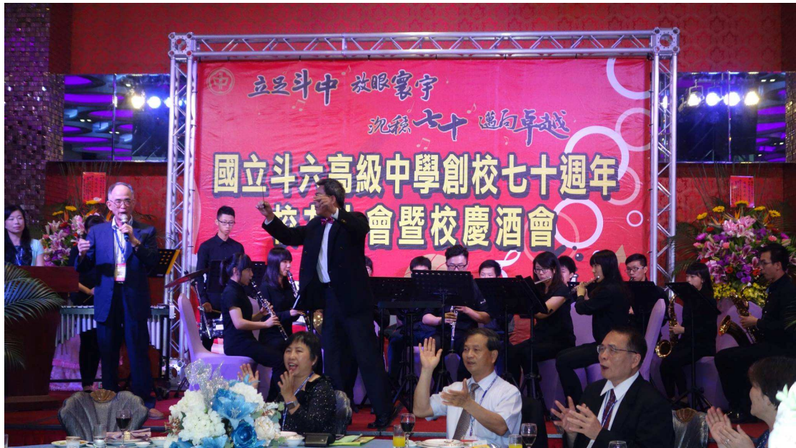
第十三屆蒲武雄學長帶領唱校歌