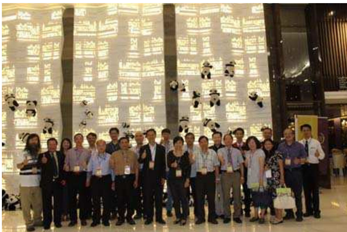
新當選第12屆理監事合照