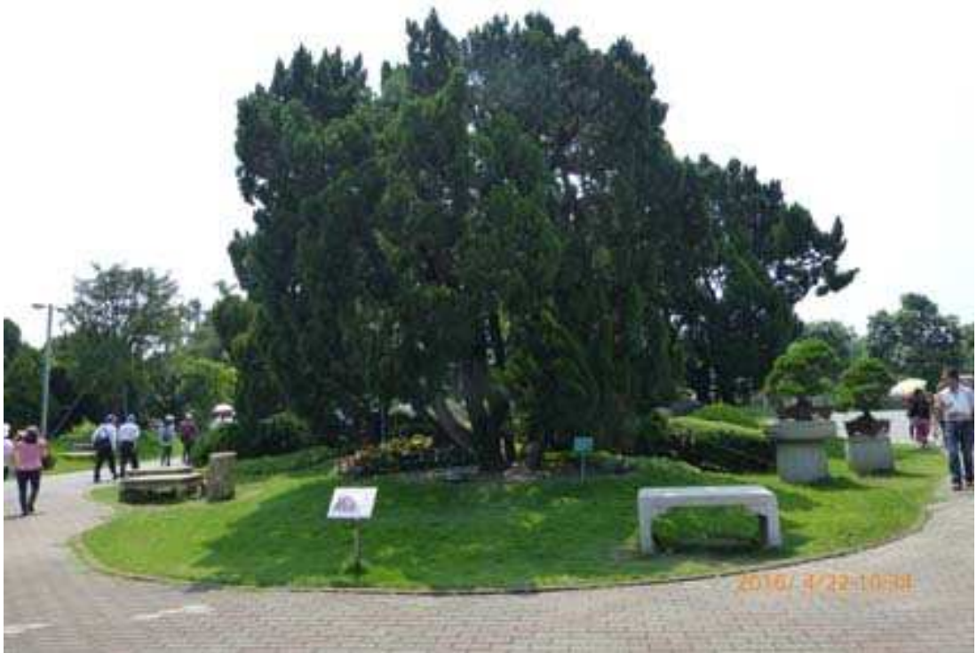
萬景藝苑老柏樹石