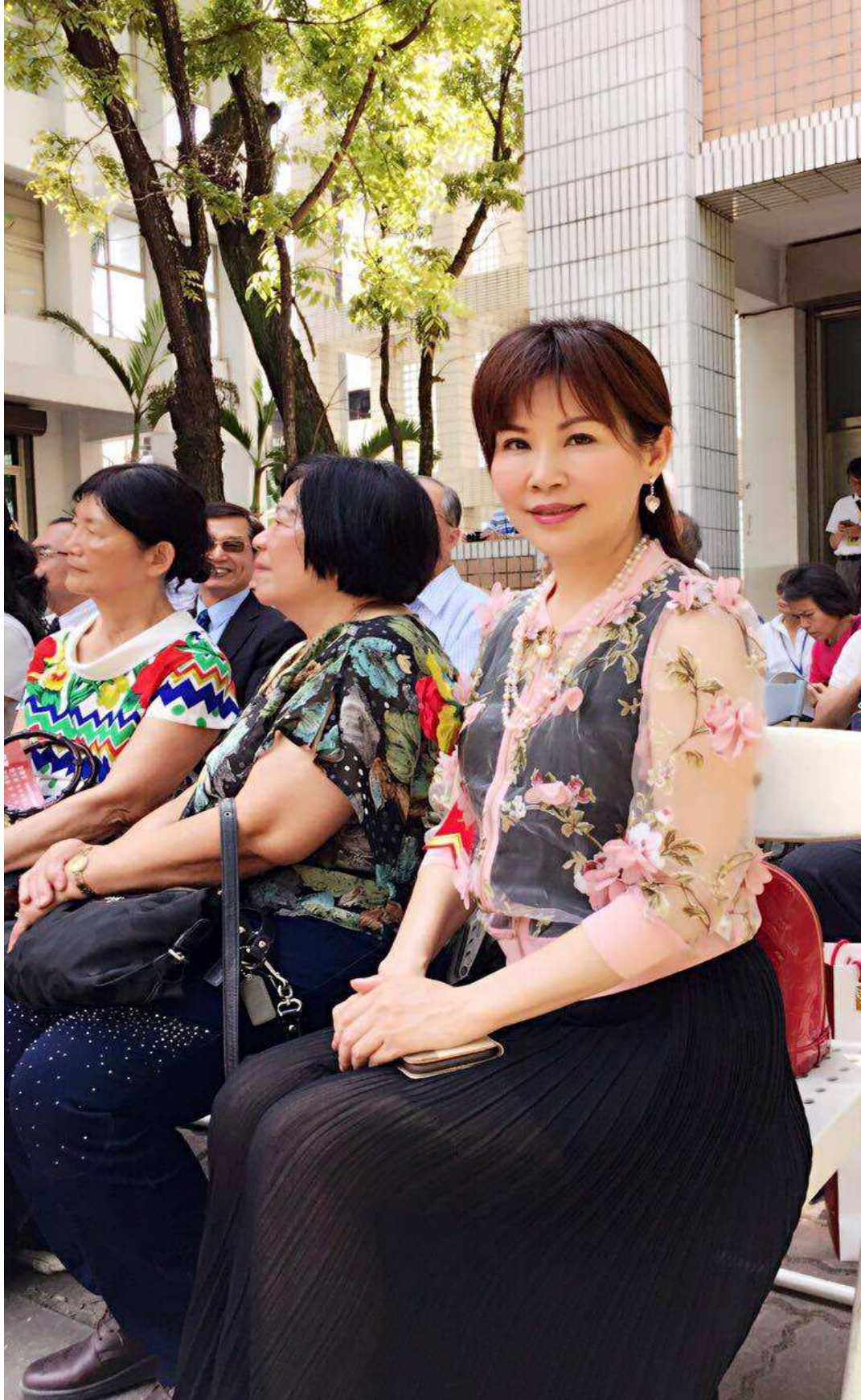
右一兩揚居士(29屆校友)