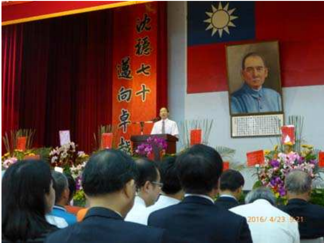
莊勝通董事長致詞