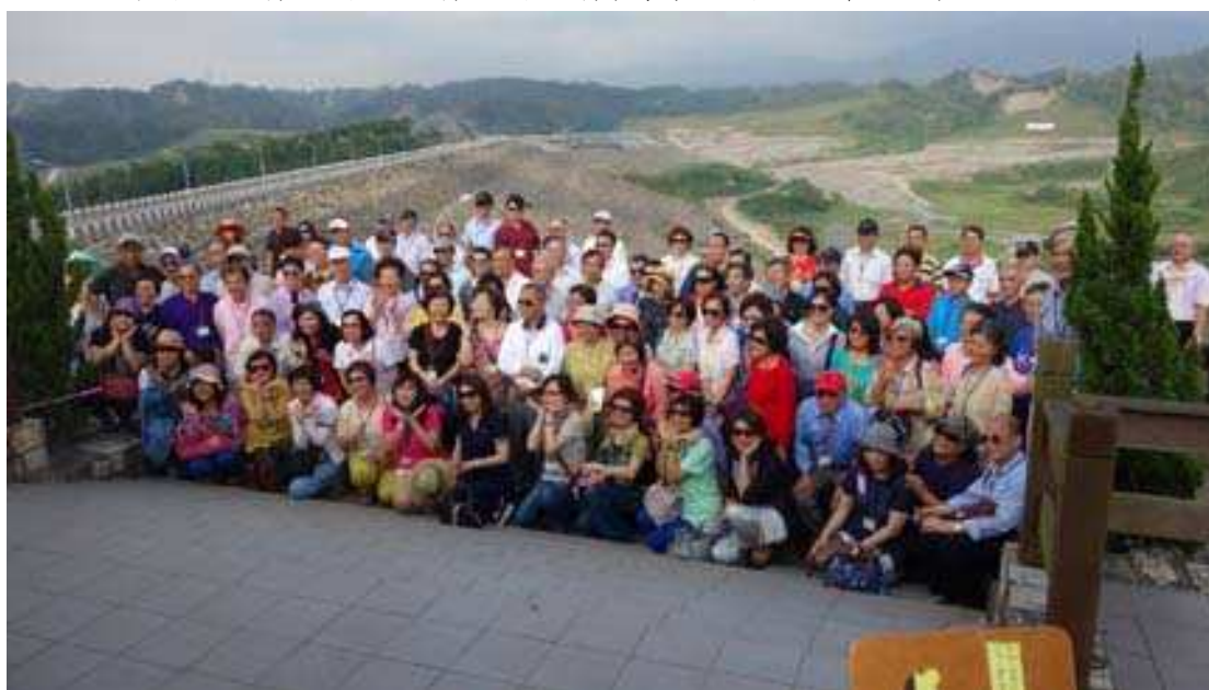
校友們在湖山水庫最高點大合照

15:20 大家乘坐遊覽車出發到大壩，湖山水庫的大壩共有三座，分別為湖南壩、湖山主壩及湖山副壩，前兩者最高達 76 公尺，副壩最高 63 公尺，由北往南分別湖山主壩、湖山副壩及湖南壩(摘錄自湖山水庫網站)。