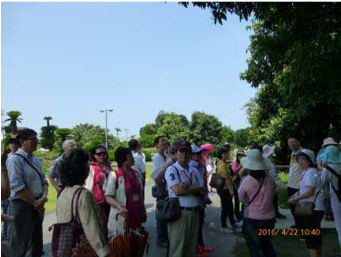
校友們聚精會神聽導覽人員講解典故