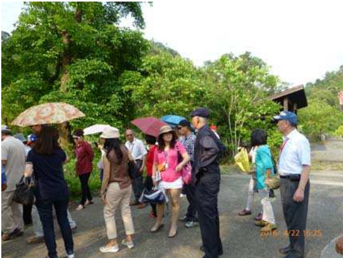
湖山水庫原生植物保存區