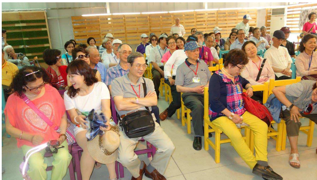
羅莎玫瑰莊園工商服務

13:15 由斗中出發至古坑羅莎玫瑰莊園(13:55 到達)，這是回娘家(轉去後頭厝)之旅的第五站。古坑羅莎玫瑰莊園是耐斯企業集團旗下香氛品牌。園區佔地 6,000 多坪，包括大型室內溫室花園及戶外玫瑰花園，園內蒐集超過 3,000 株、500 個品種的玫瑰花及香草植物。帶您了解玫瑰的發展歷史和應用，以及精油萃取的過程，提供各種天然植物萃取產品的體驗。