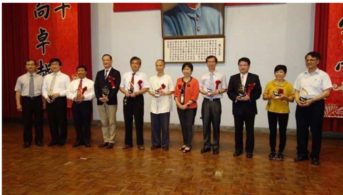
第十三屆傑出校友合照