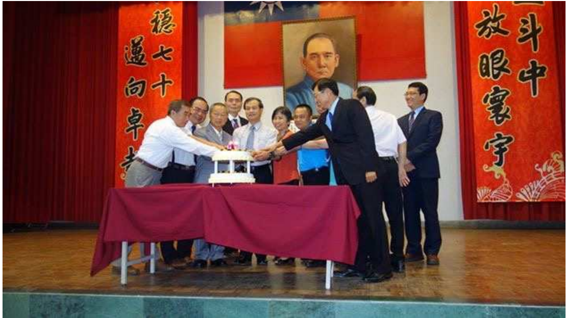
貴賓切蛋糕慶祝校慶