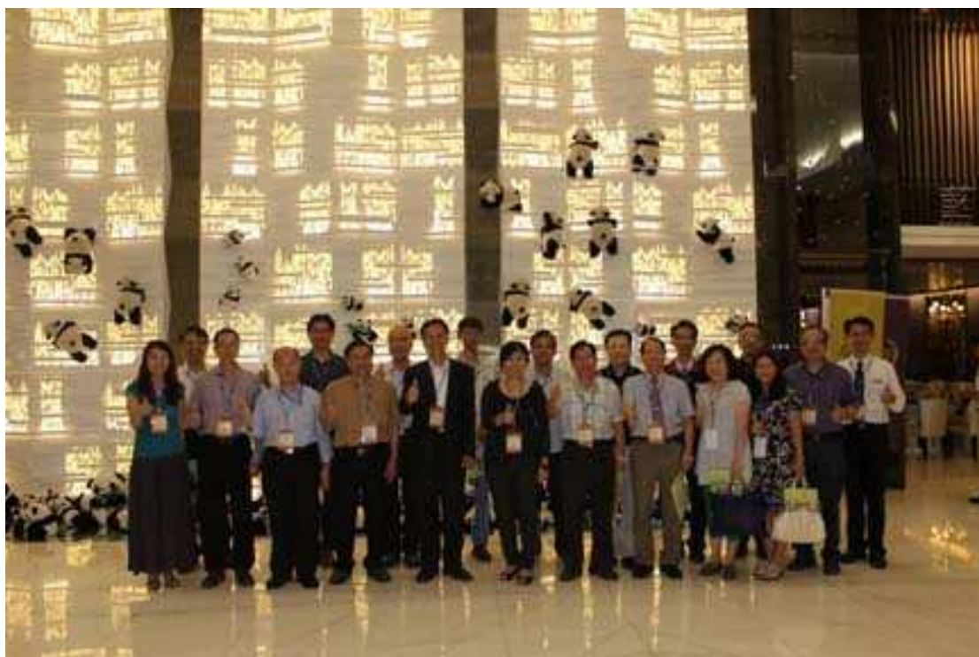
新當選第12屆理監事合照