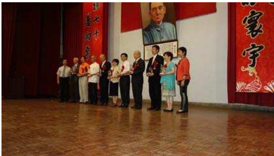
第十三屆傑出校友合照