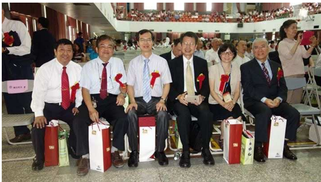
第十三屆傑出校友合照