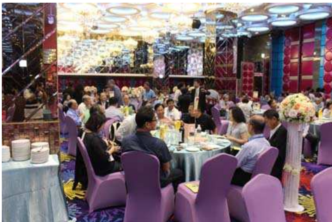
校友會會員大會會場