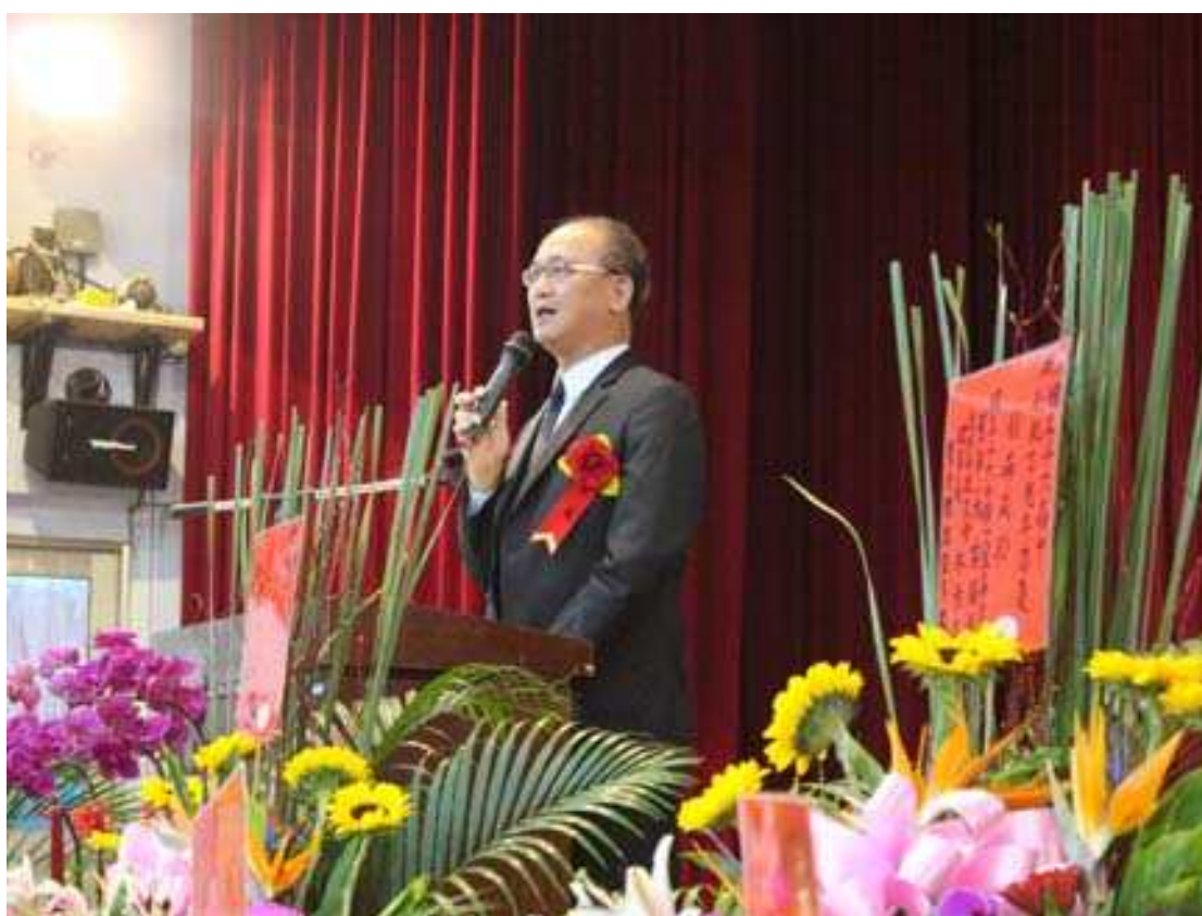
教育部常務次長林騰蛟致詞