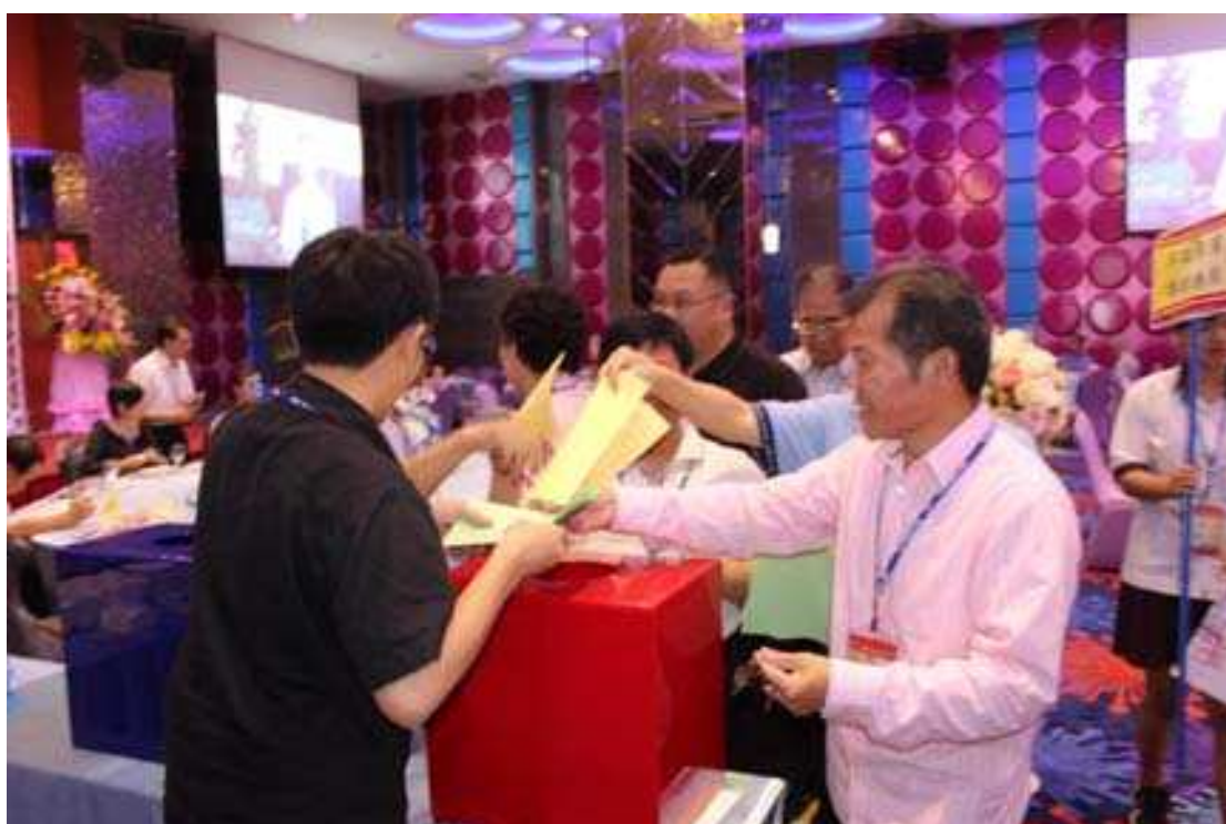
選舉 12 屆理監事